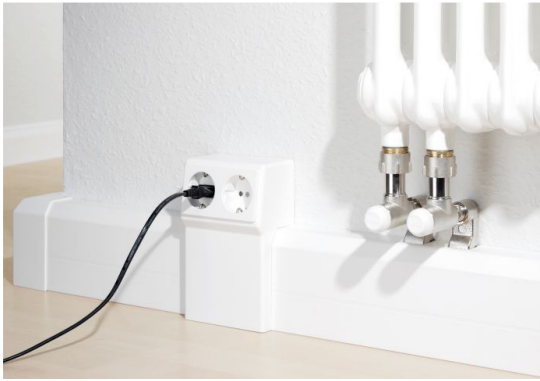
Slika 12. Rauduo s dvostrukom priključnicom