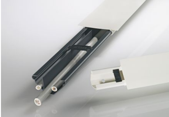
Slika 7. Kutni kanali tip ECK by OBO