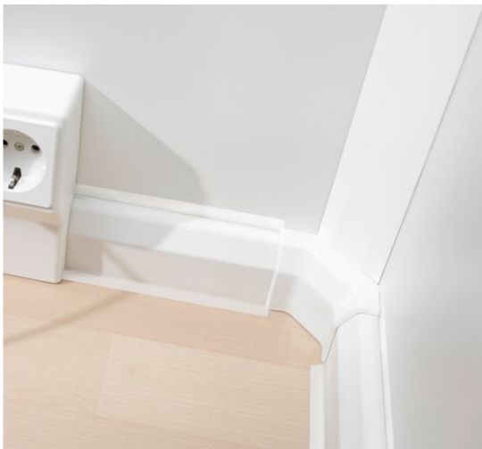
Slika 8. Spoj kutnog i instalacijskog kanala