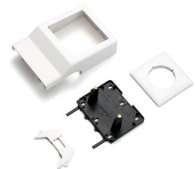
Slika 4. Prazno kućište SL ETI