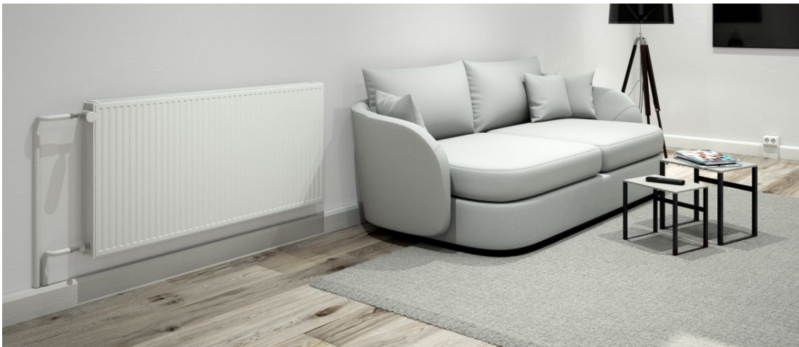
Slika 14. Gotova instalacija pomoću kanala Rauduo