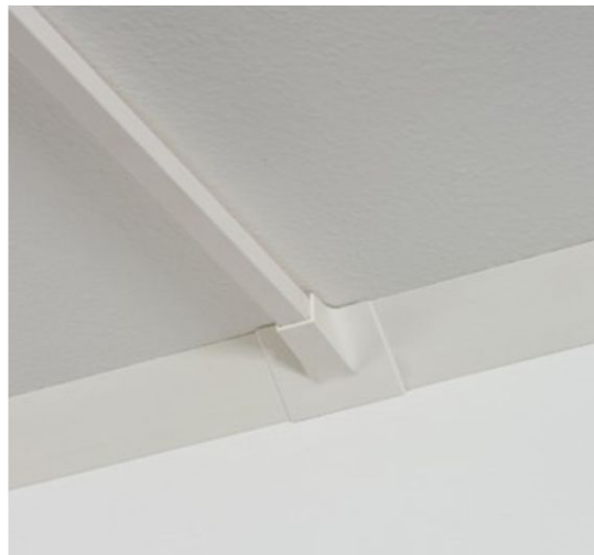
Slika 9. Odvojak na stropu