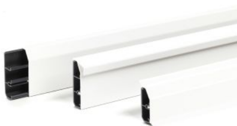
Slika 3. Izvedbe instalacijskog kanala SL

Instalacijski kanal SL dostupan je u tri veličine i tri različite izvedbe: