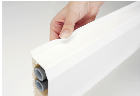
Slika 13. Poklopac s brtvom RDL OT