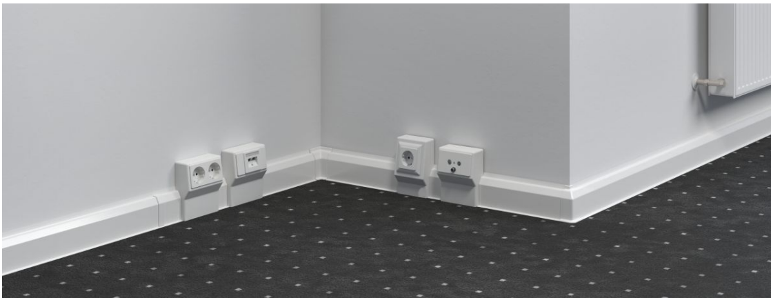
Slika 2. Gotova instalacija s instalacijskim kanalom SL